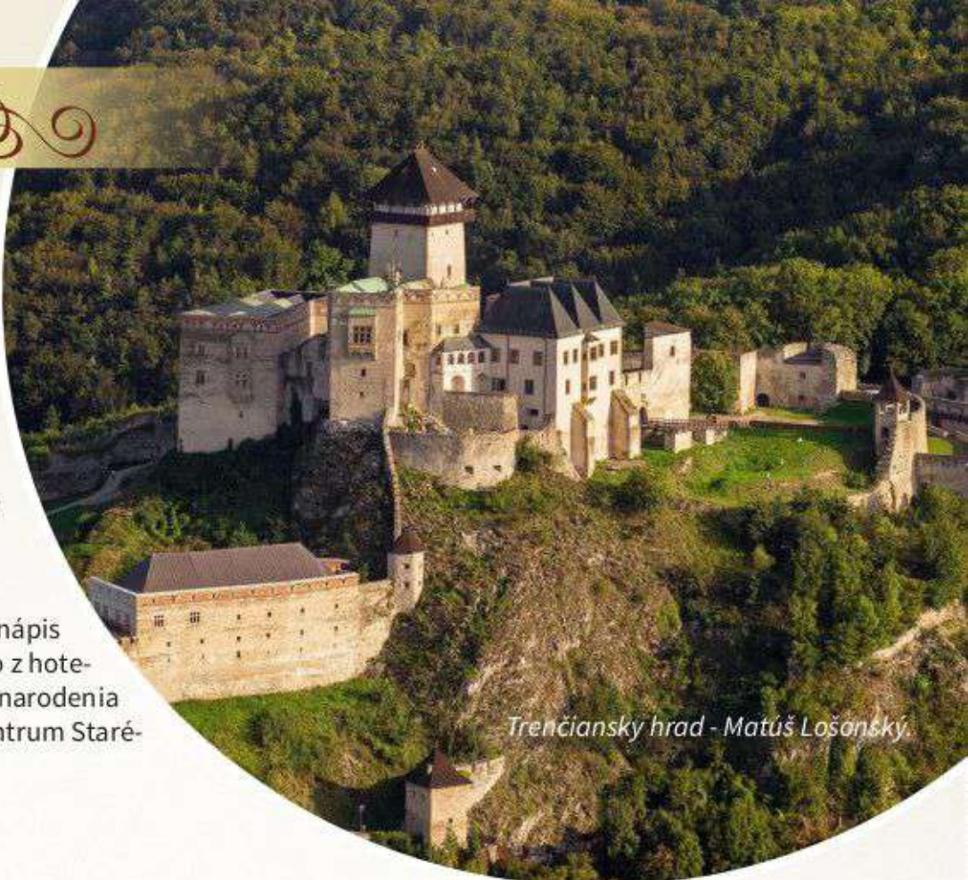
Trenčiansky hrad - Matúš Lošanský

Morový stĺp, Synagóga, Rímsky nápis na hradnej skale (výhľad priamo z hotela), Mestská veža, Farský kostol narodenia Panny Márie, Farské schody (centrum Starého mesta), Synagóga.